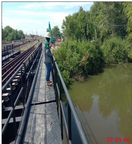
รูปที่ 2-26 ภาพพื้นที่กองดิน