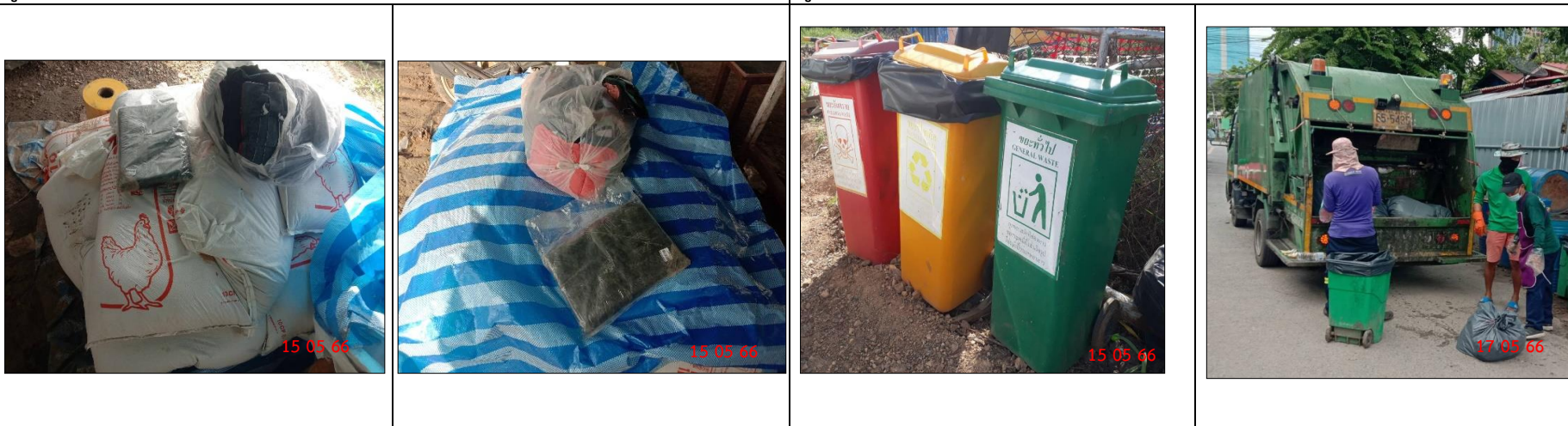
รูปที่ 2-19 วัสดุดูดซับสำหรับทำความสะอาดน้ำมัน