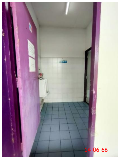
การล้างห้องน้ำสถานีรถไฟเชียงรากน้อย