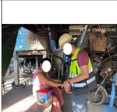
การมอบของแก่ผู้สูงอายุบริเวณพื้นที่โครงการ