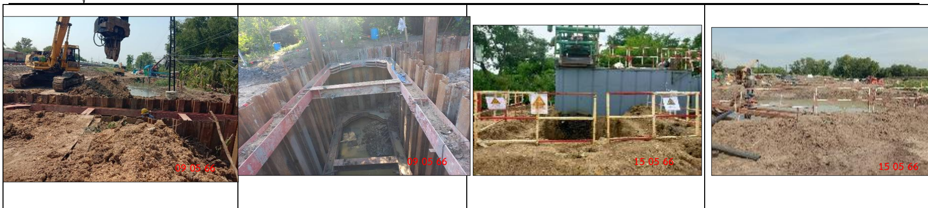
รูปที่ 2-17 ติดตั้ง Sheet Pile ในพื้นที่ที่มีความเสี่ยงต่อการพังทลายของดิน